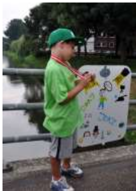
ja, je mag er trots op zijn