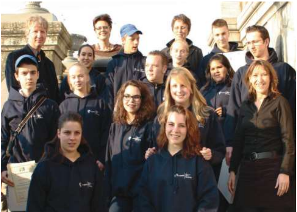
De eerste lichting jongerenbuurtbemiddelaars van Maastricht