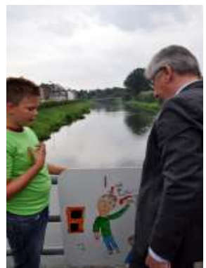
en deze heb ik gemaakt!!!