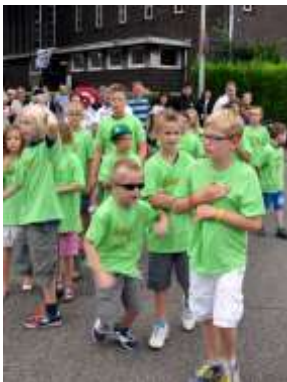
De jonge kunstenaars