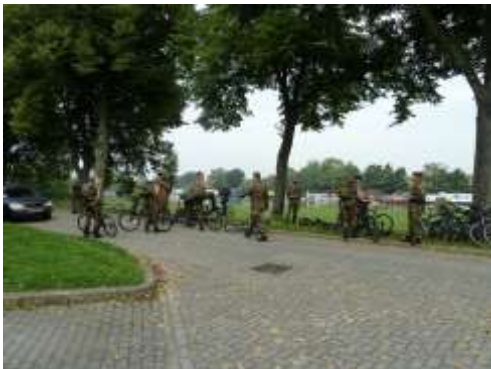
En daar gaan ze dan, op weg naar Eben-Emael met volle pakking op de rug.....