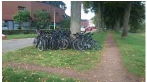
De mountainbikes staan al klaar voor de start.....