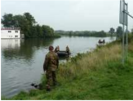
De eerste troepen zijn in zicht.....