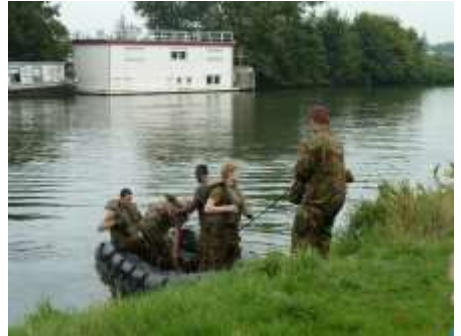
En komen aan land.....