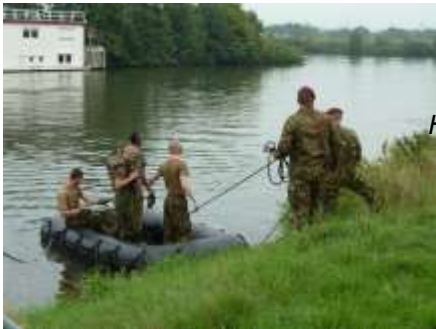
Het roeien op de Maas viel nog goed tegen....